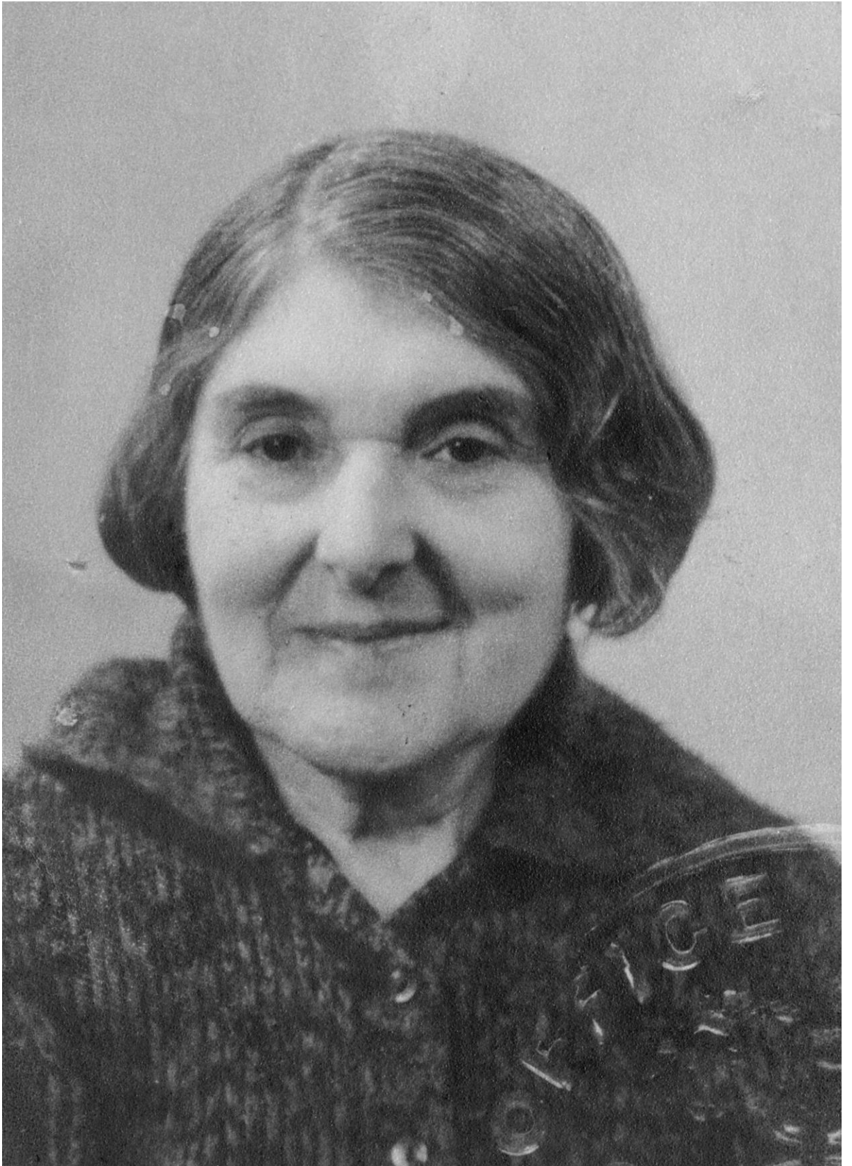
Abbildung 9: Letztes Bild von Veza Canetti, 12. Februar 1963