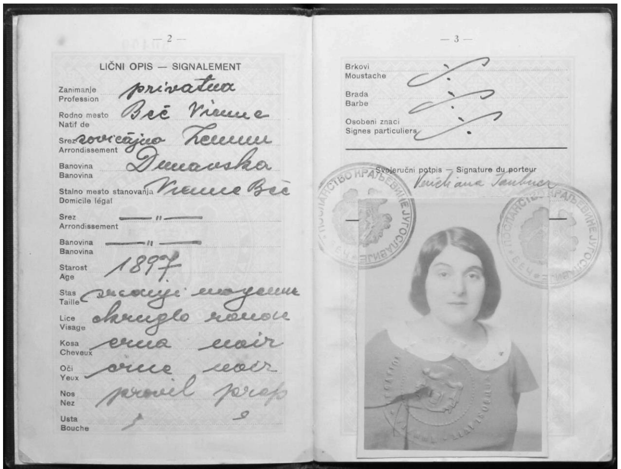
Abbildung 4: Jugoslawischer Pass von Venetiana Taubner (1938)